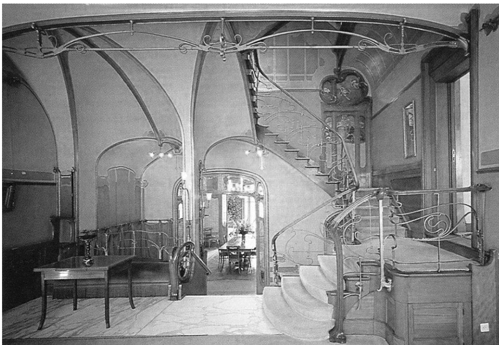
La maison de Victor Horta

(1) A la fin du XIXe siècle, la Belgique est un pays prospère. Ses mines, ses usines et ses colonies africaines enrichissent une bourgeoisie industrielle et commerçante, qui adore la nouveauté. C'est le roi Léopold II qui engage de grands travaux à Bruxelles. La capitale s'agrandit de nouvelles avenues, des parcs sont aménagés et des bâtiments de prestige sont construits. Mais le dynamisme n'est pas seulement économique et architectural. Dans les domaines intellectuel et artistique, Bruxelles est aussi à l'avant-garde de la modernité.